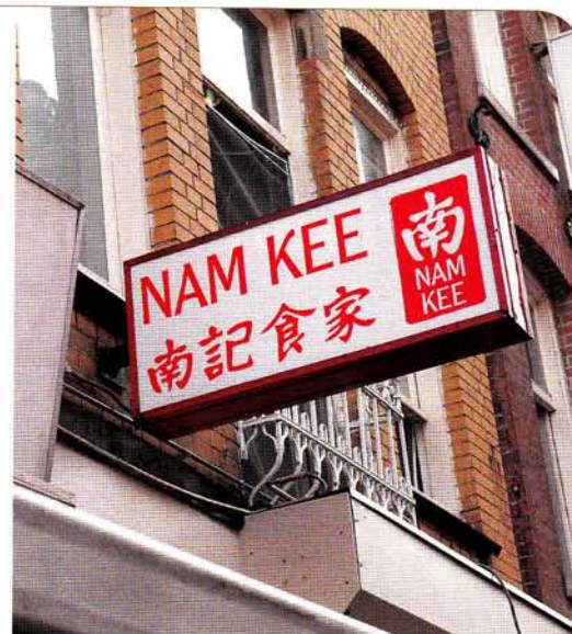
Het Chinese eethuis Nam Kee werd nationaal bekend door de roman 'De Oesters van Nam Kee'.

„Ik kan me niet herinneren dat er een tijd was waarin ik niet wist dat